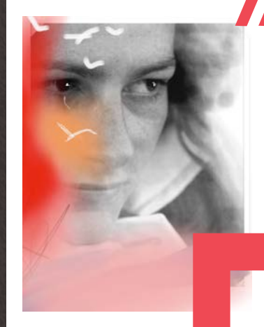
Florence Arthaud, la petite fiancée de l'atlantique

J'allais pas abandonner, j'ai jamais abandonné une course de ma vie. Et quand j'ai vu l'avion de thalassa qui me survolait et qui m'a dit que j'étais en tête, j'y croyais pas !